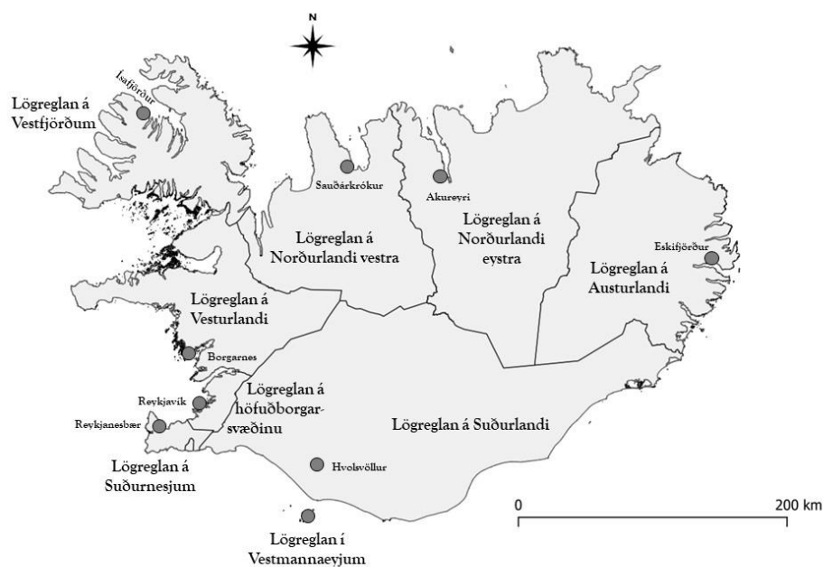
Mynd 1: Lögregluumdæmin á Íslandi.